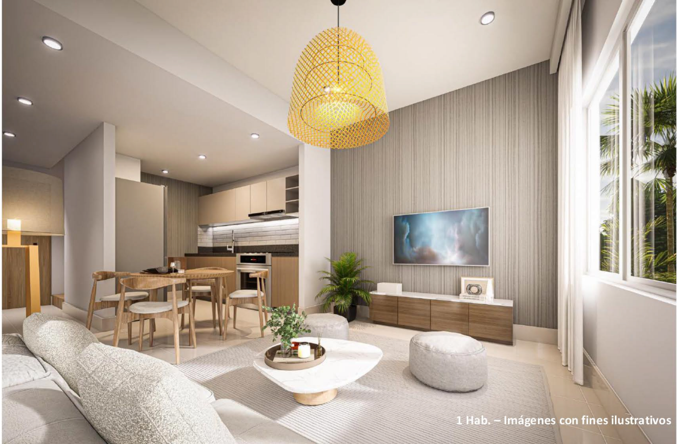
1 Hab. – Imágenes con fines ilustrativos