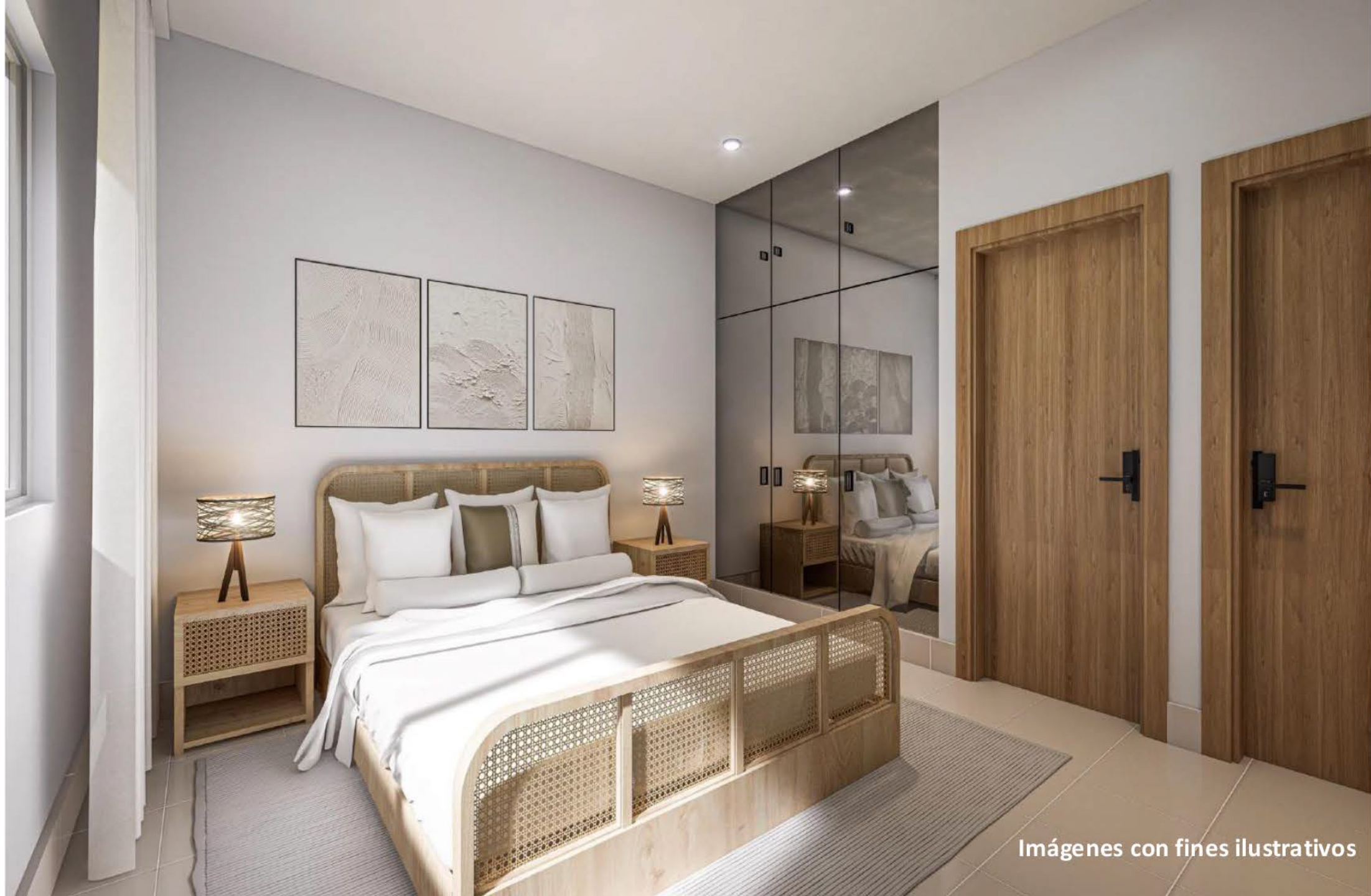
Imágenes con fines ilustrativos