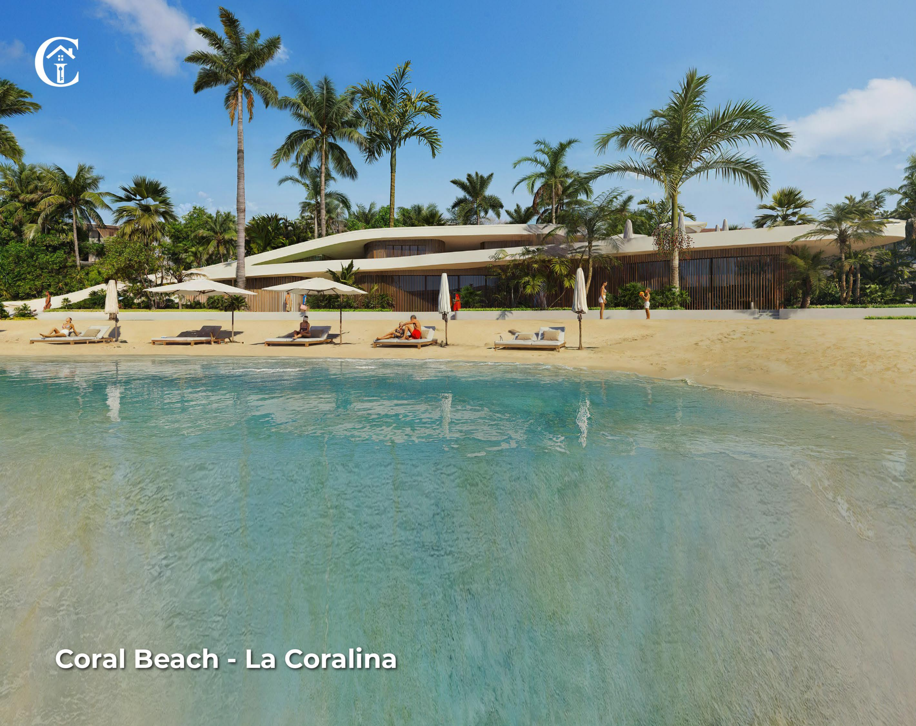
Coral Beach - La Coralina