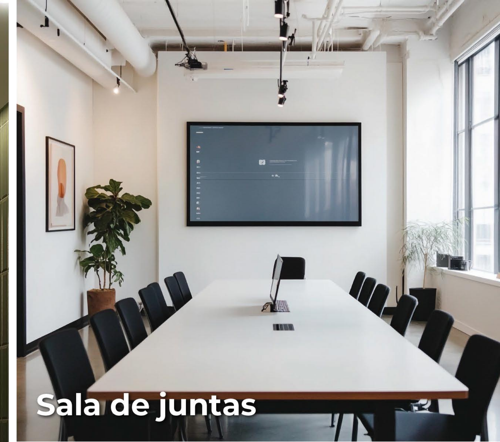
Sala de juntas