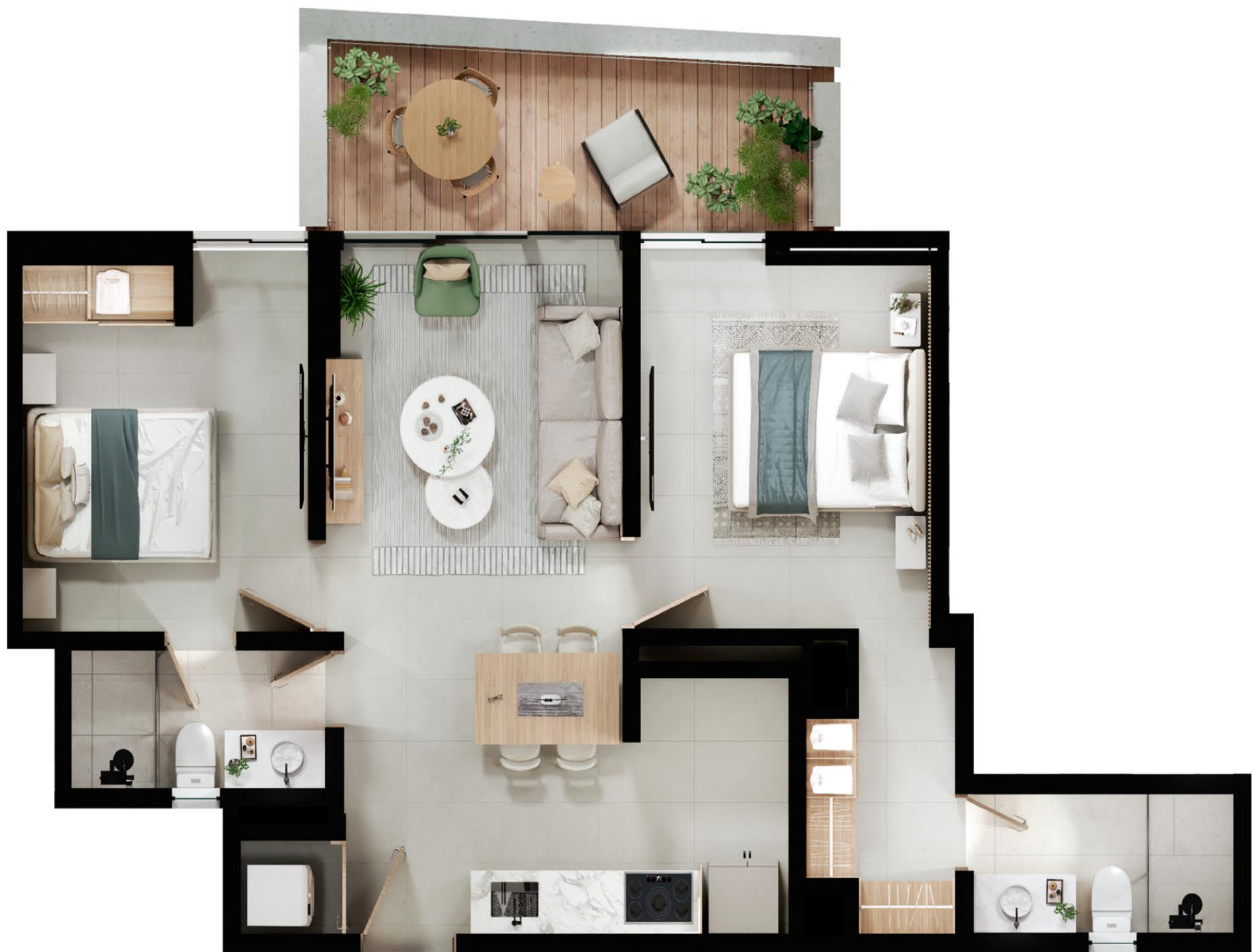
Tipo J 15