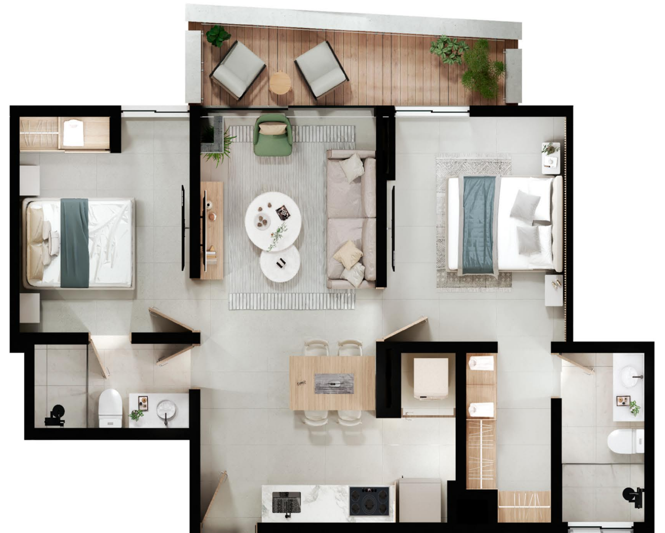
Tipo J 16